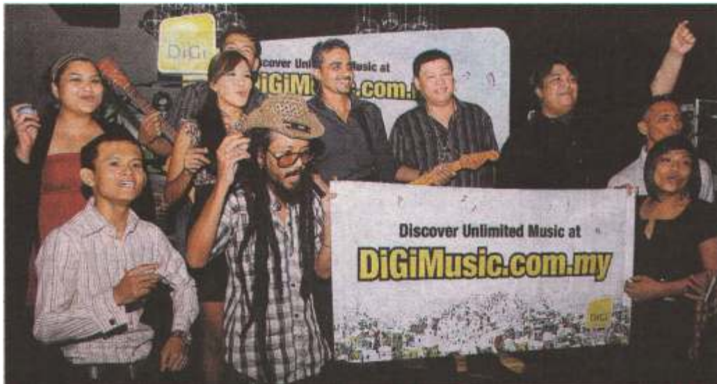
KAKITANGAN DiGi Telecommunications bergambar sempena pelancaran perkhidmatan muzik mudah alih dan web muzik tanpa had DiGi di Petaling Jaya, kelmarin.